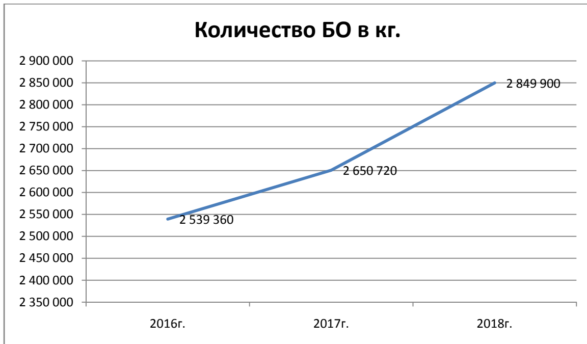
фигура 2 Събран и извозен БО за 2016г., 2017г. и 2018г.

Количествата разделно събрани отпадъци от опаковки за 2018г. са следните; Хартия - 12 760кг.; Пластмаса - 2 440кг.; Полиетилен - 500кг.; Общо - 15 700кг.