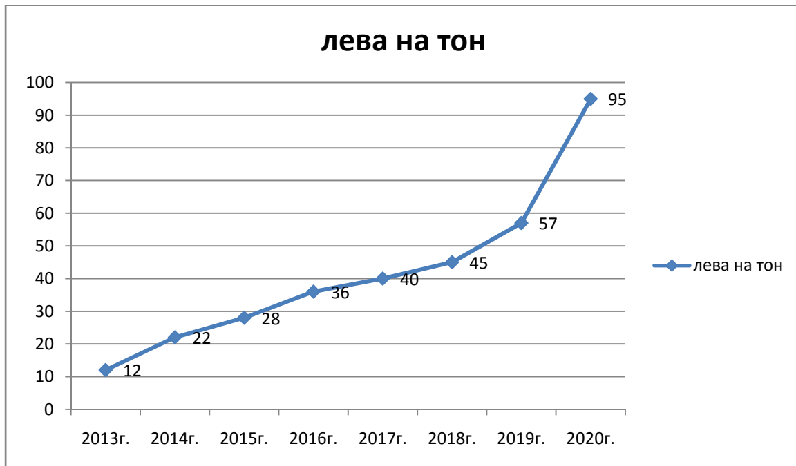
фигура 3 Размер на отчисления по чл.64 от ЗУО

Ежегодно нарастващия размер на отчисленията, при депониране на БО е едно от основанията и причините да търсим начин за намаляване на извозваните количества БО към регионалното депо, а основния път и начин за това е да се отдели от общия отпадък този който подлежи на преработка.