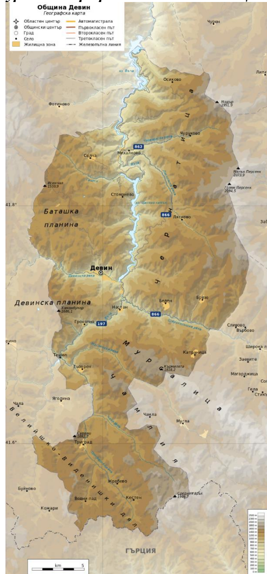
Фигура 1. Географско положение община Девин